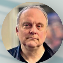
Künstlerische Leitung: Bernhard König Komponist